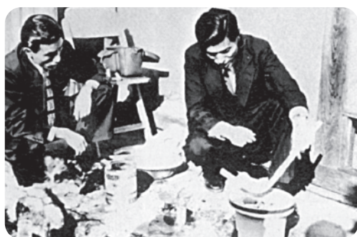
組合内管工部設置(1953)