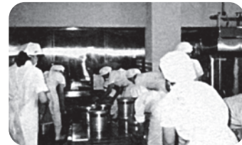
中小企業福祉事業協同組合(1963)