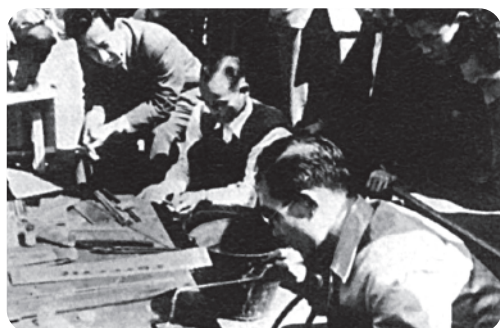
溶接技術講習会開催(1958)