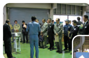
企業購買担当様との交流会