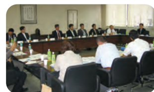
立地企業との交流会