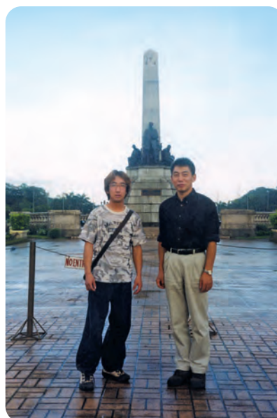
研修旅行(フィリピン)