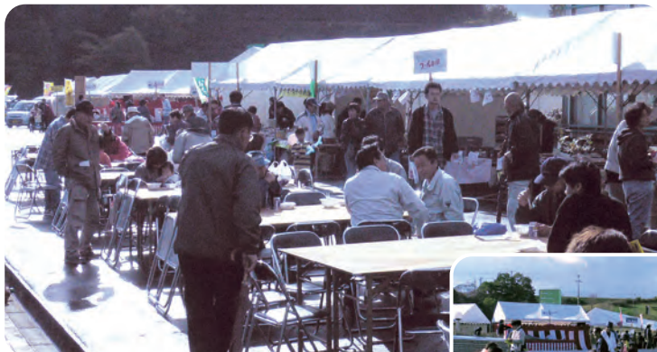
あやべ産業まつり風景