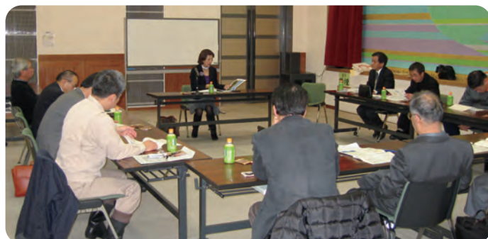
研修会(中国の発見と日本の気づき)