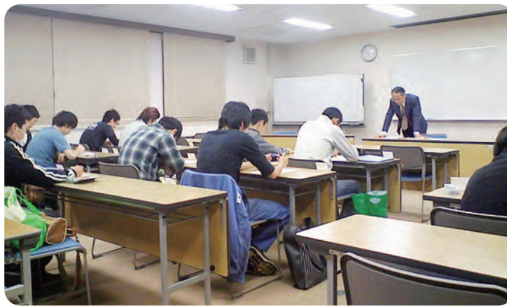
綾部工業研修所 授業風景