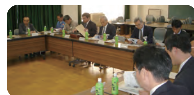
専門高校見学会(京都府立工業高校)