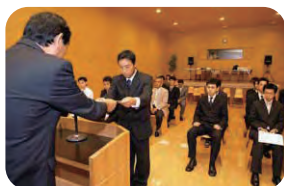
綾部工業研修所 卒業式